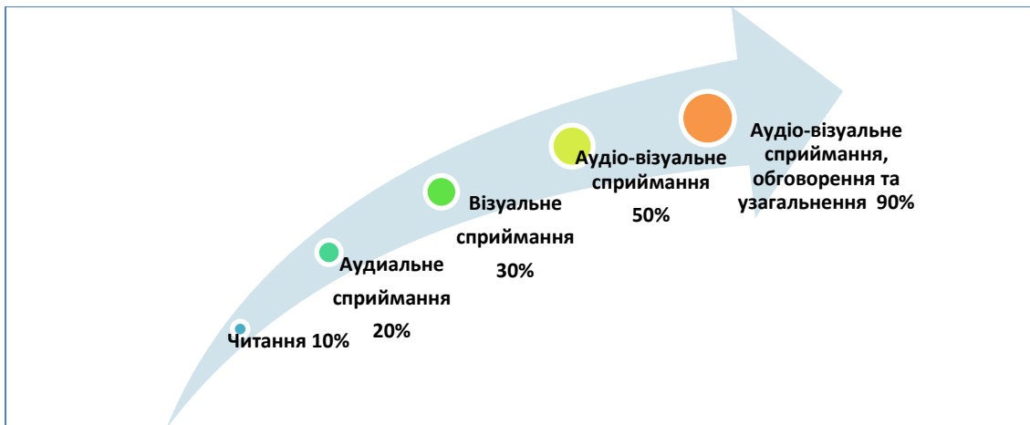
Рис. 1 Механізм засвоєння навчальної інформації

Створення і використання відеоуроків зумовлюється особливостями засвоєння учнями навчальної інформації при одноразовому виконанні певного виду навчальної діяльності (Рис. 1)